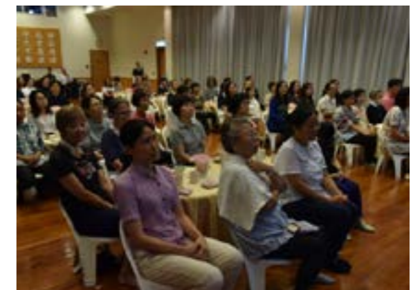
民眾透過講者分享的照片了解災區情況