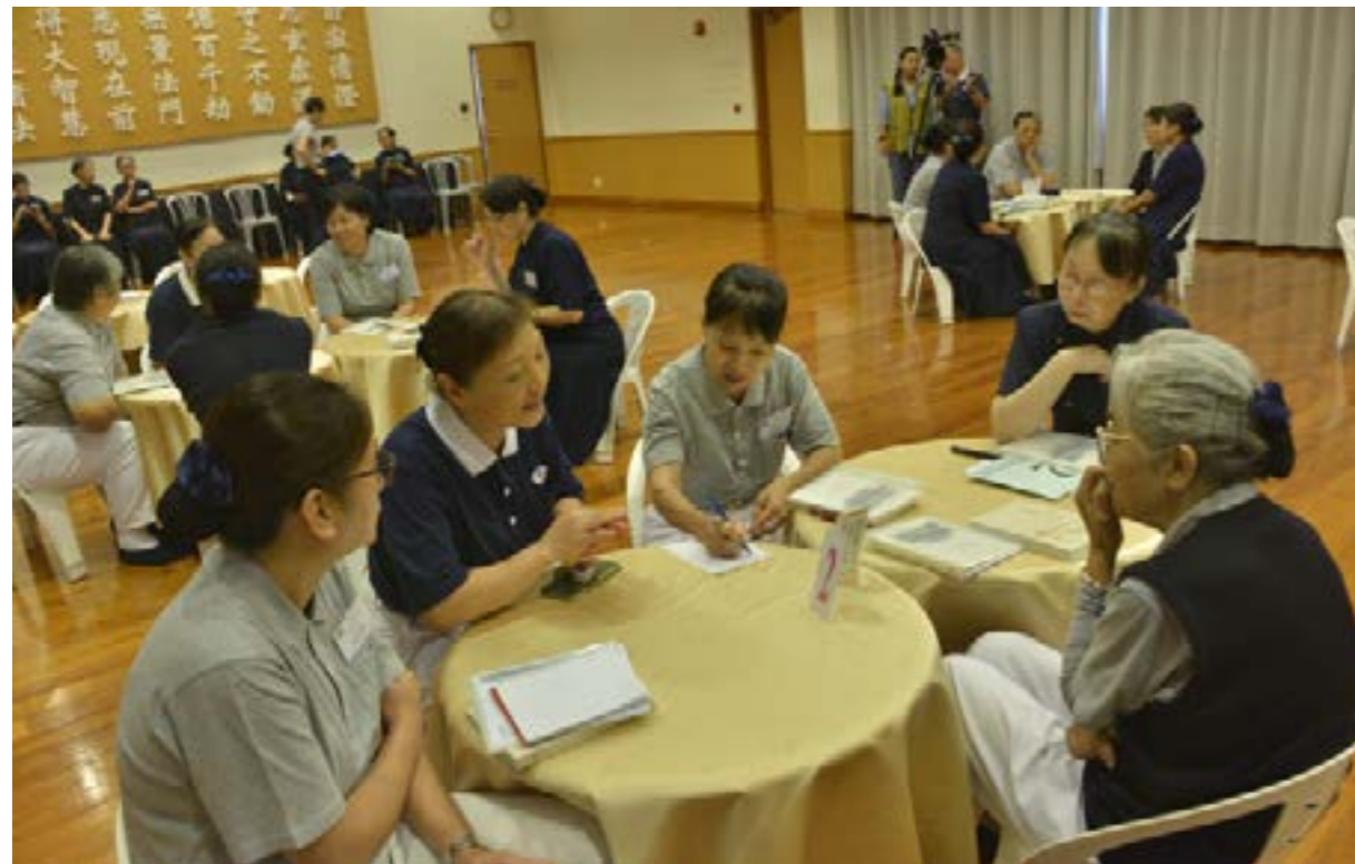
學員分組進行課程討論及心得分享

上人近來一直強調莫忘那一念、莫忘那一年、莫忘那一（群）人、莫忘那一事。不忘初心，砥礪前行。初心就是我們最初的那份感動，讓我們有緣入了慈濟，隨著上人行在菩薩道上。菩薩道是喜樂的，也是艱難的，世間事很容易讓我們丟了初心，偏離正確的方向。因此，時時自我警醒，也彼此勉勵，不要離開上人艱辛為我們鋪設的大道。堅定前行的同時也要繼往開來，為後來的人鋪出更平坦更寬廣的路。