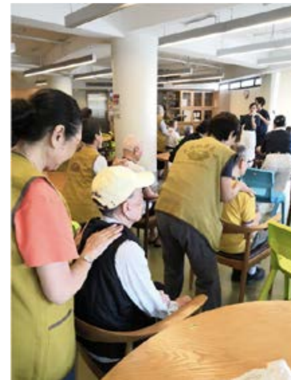
志工的貼心按摩，讓長者感受滿滿的愛