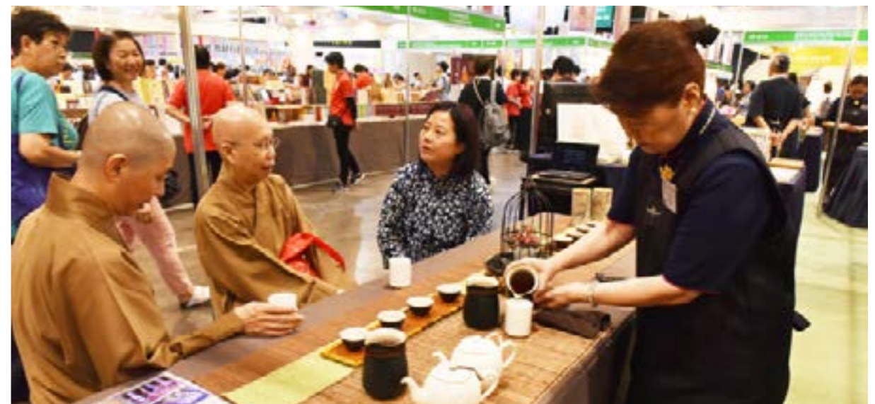
攤位設置菩薩招生區並提供淨斯茶給訪客享用