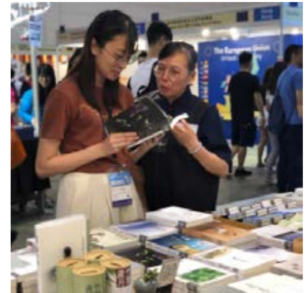
一樓攤位志工向訪客講解「讓愛非揚」的意義