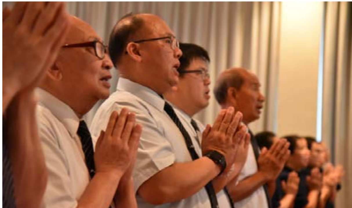
志工雙手合十虔誠祈禱