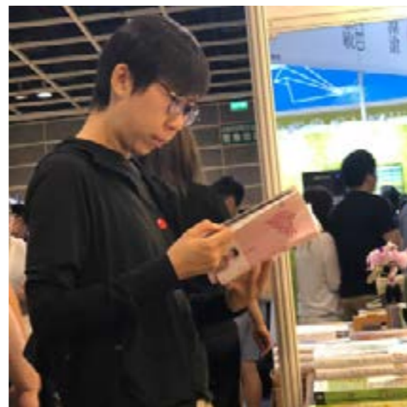
《轉念，與自己和解》一書，深受讀者喜愛