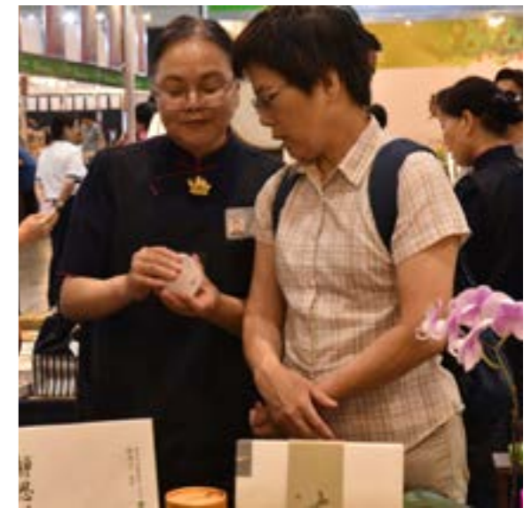
純天然的淨斯產品，深得訪客喜愛