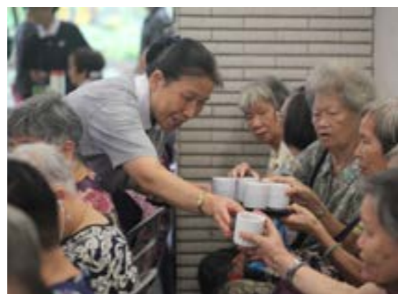
志工用淨斯產品製作茶點給民眾享用

活動中，志工除了介紹淨斯產品，也用淨斯產品做莓果燕麥糕和淨斯茶，請參與者品嚐。清淨在源頭，我們不僅要注重大地的環保，心靈的環保也一樣的重要。淨化環境，淨化人心，人間就會變成一片淨土。