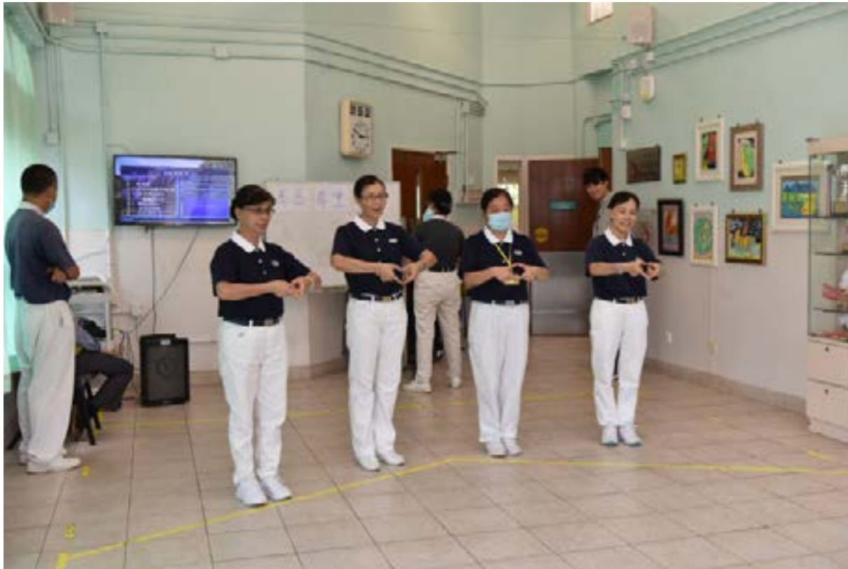
志工以優美的手語演繹〈感恩、尊重、愛〉