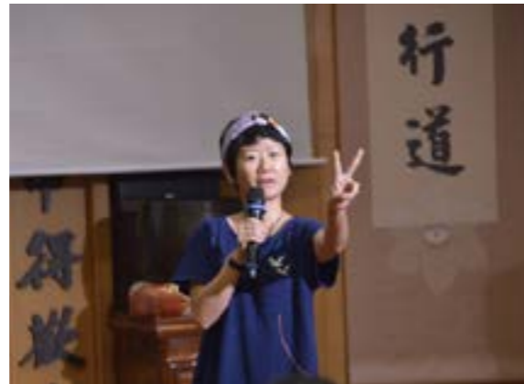
Vee 導演講解表演技巧和心得

讓我們一起努力，如上人期待「大家合和互協、共同完成」，呈現給大眾一場「有道氣、有真實法的法會」，祈求人心淨化、社會祥和、天下無災難。