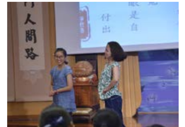
「猜猜估估靜思語」遊戲用手語和肢體語言呈現靜思語