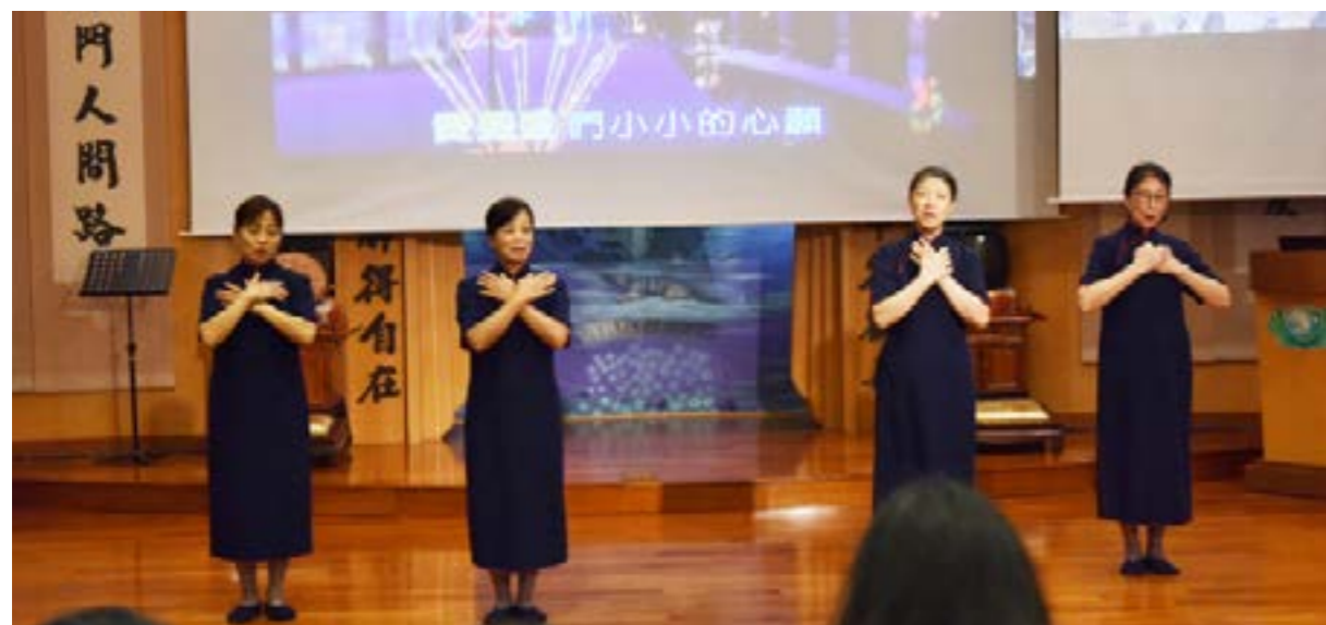
志工為來賓演繹慈濟手語歌〈讓愛傳出去〉

天主教明愛的朋友來參訪交流，除了對慈濟的肯定，對於未來彼此合作、努力的方向也有很寶貴的啟示。希望雙方加強合作，攜手讓愛傳出去，讓大愛的精神傳遍每一個角落。