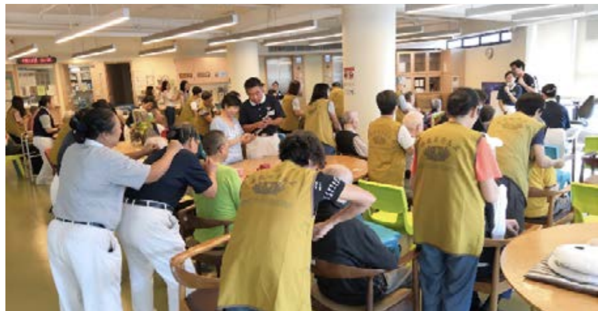
志工替院友按摩肩頸

三位由社工帶來的義工也做了分享，她們覺得慈濟志工跟院友關係很密切，感覺好像家人，而院友向她們表示每月期待慈濟志工來訪。她們說對這次探訪有很大的感受，發現自己有能力可以跟長者互動得很好。