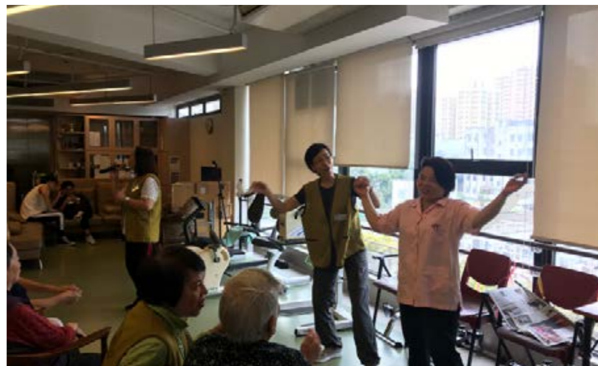
志工帶動院友愉快歡唱

每次的探訪，志工總感覺時間飛逝，結束時大家都依依不捨，期待下次與他們再相聚、再付出。