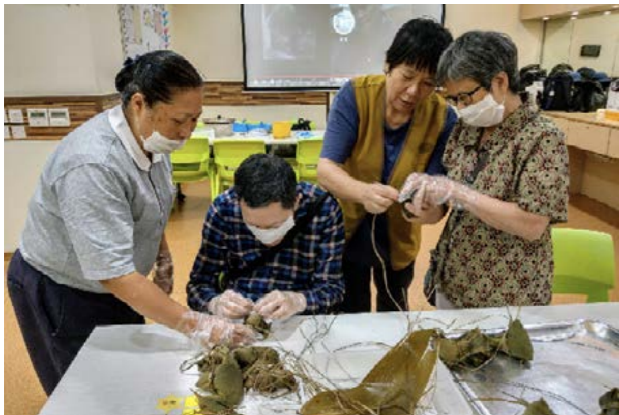
志工準備了粽葉和餡料，和院友一起包粽