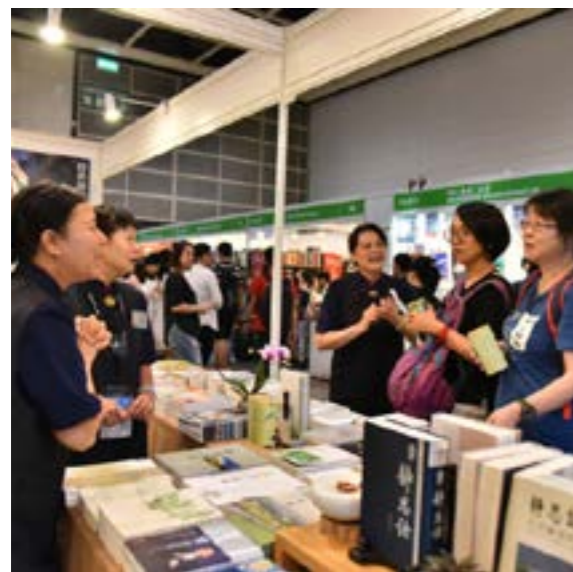
一樓攤位有展示靜思語及素食書籍

一位年輕的女子選購了本《轉念，與自己和解》，並當場專注閱讀。與志工交談中，她透露他患病的爸爸在臺灣得到慈濟的幫助，成功配對了骨髓，身體恢復健康，非常感恩慈濟。她表示知道了慈濟的大愛臺，以後可從中多瞭解慈濟的志業。