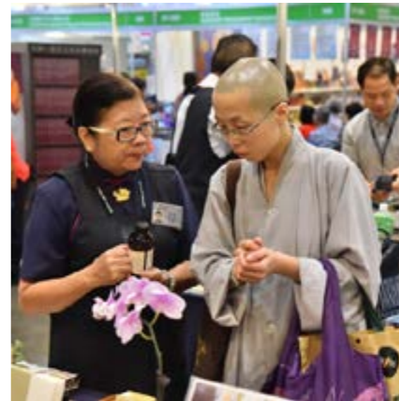
志工向出家師父介紹淨斯產品