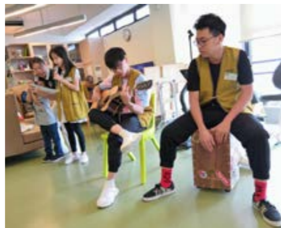
慈幼和慈少以歌唱和樂器表演〈真的愛你〉

也是第一次到護老院探訪的芳芳說，歡樂、溫馨的氣氛令她好震撼，而有的伯伯年紀不算大但身體卻很弱，令她明白平時要多做運動保持健康。