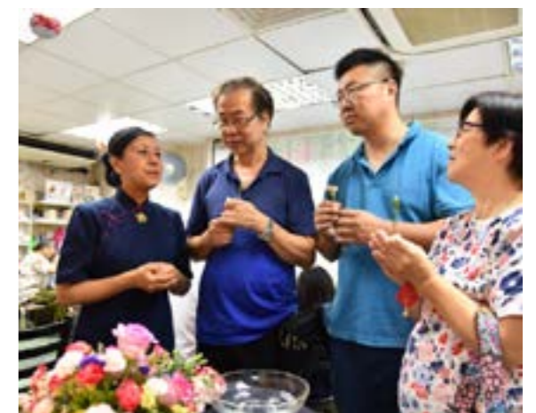
民眾專心聽志工講解佛誕的意義