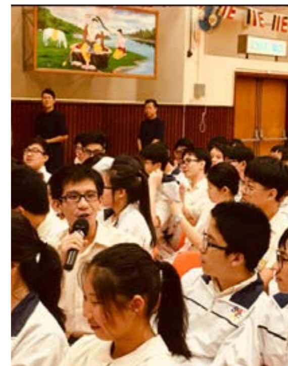
同學們針對佛系思想發表感受