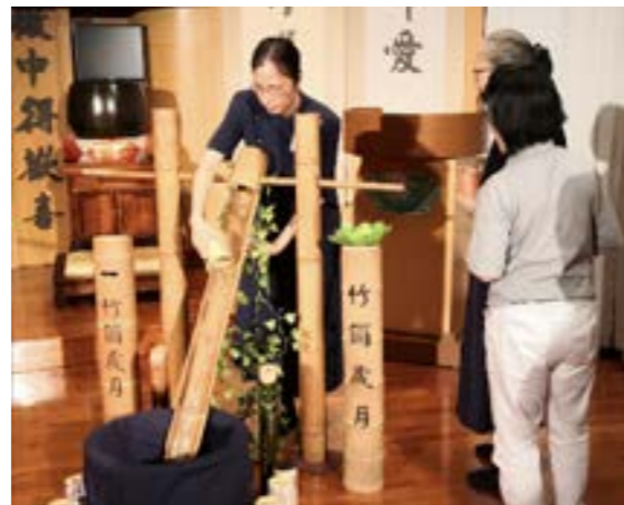
拜經結束後大家發揮善心投竹筒

雖然我們不能到災區去付出，但我們可以虔誠為他們祈禱，把我們的心念上達諸佛聽，祈求他們遠離災難；我們可以去募款募心，讓善行共振，凝聚福緣。當天有呼籲大家把竹筒帶回來，裡面的每一分、每一毫，都是對災民的祝福，每一點、每一滴，都是善念的匯聚。上人說：「多少人間受苦難，多少菩薩在人間！」只要願意伸出雙手去擁抱他們，人人都是人間菩薩。