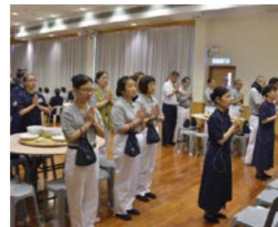
課程教授學員食的威儀