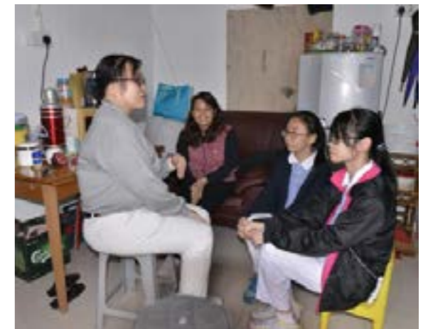
志工帶領慈少入民宅做訪視