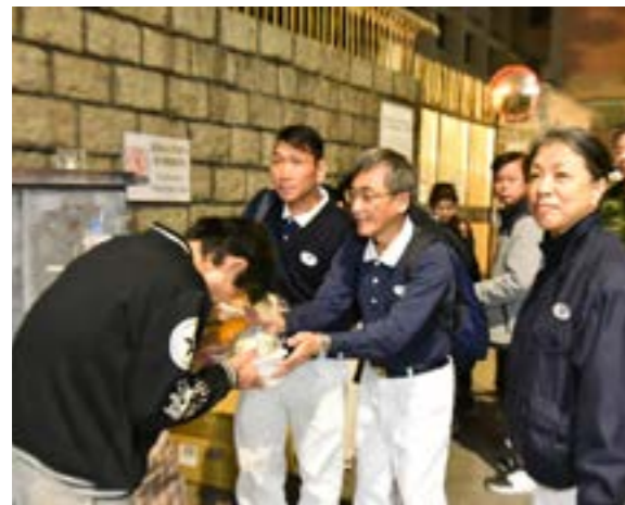
志工探訪在油尖旺區的露宿者