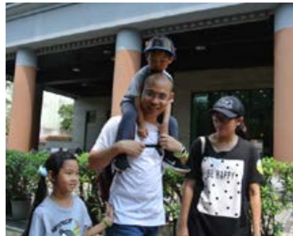
親子參與健康又充滿善念的活動

參與此次健行的志工以及民眾共計三百多位；大家以感恩與助人為樂的心，圓滿了這場送愛到東非三國的善行活動。