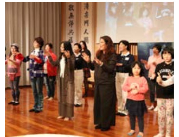
午飯後的手語帶動唱