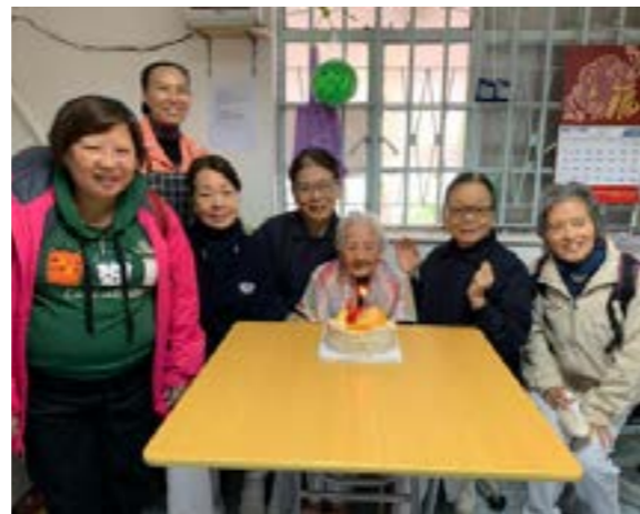
婆婆104歲生日有志工陪伴祝福

麗娟婆婆交談時有問有答，腦筋非常清晰，精神也滿不錯的。志工離開時，她總是有點不捨，說：「咁快就走啦！」志工問她，還要不要他們來探訪，她會很大聲地回答：「要！」志工都希望下次可以陪婆婆久一點！