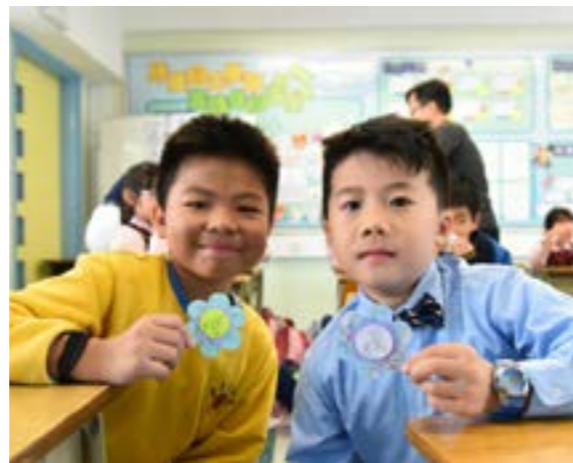
同學們分享靜思語小卡