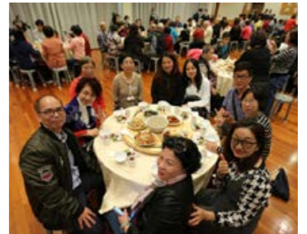
居民們吃得非常歡喜