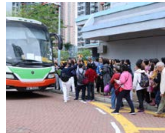
分會租用兩輛旅遊巴士接載居民