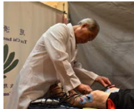
醫師用儀器為民眾舒緩痛處