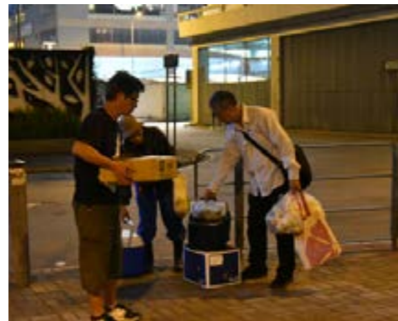
街友協助將晚餐送至觀塘公眾碼頭

原本手心向上留宿牛頭角麥當奴的街友，跟隨慈濟志工探訪、派福飯、淨山，走出人生的黑暗，付出回饋，還陪伴其他街友，以生命影響生命。