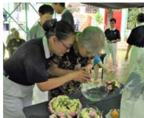
志工牽著院友的手虔誠浴佛

在花園的十三位院友在志工陪伴下，享用了小點心，唱歌，做手部運動。〈一家人〉的手語演繹後，浴佛活動便在歡喜中圓滿。志工給院友致送山藥薏仁粉，作為他們的營養補充品。