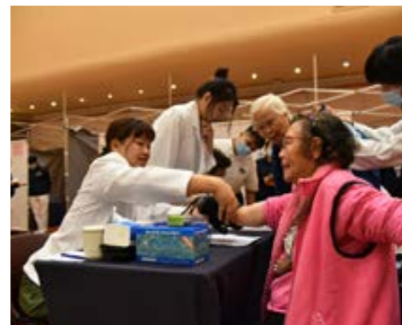
醫護人員幫民眾測量血壓