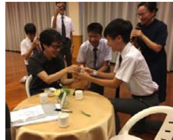
兩位同學向師長行「奉茶之禮」

接近尾聲，是茶點時段，志工還給訪客送上結緣品，其中有小本《靜思語》，期盼學子能細味個中的意涵。離情依依，同學希望下次有更多時間交流。