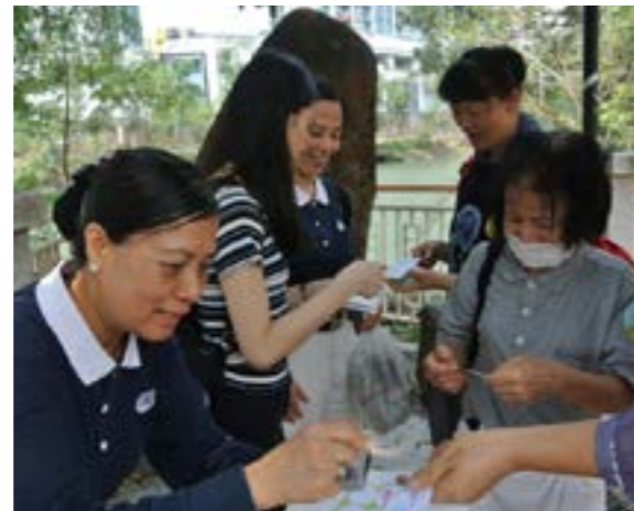
參加者過關即可蓋印