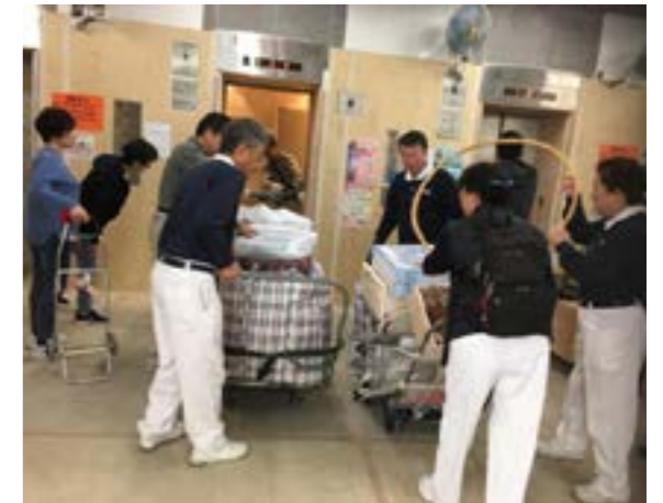
志工齊心合力幫阿芬搬運物資

阿芬的家搬遠了，但心與法親仍然很近。她現在每個星期一仍然到環保站付出，還帶來一位新志工。