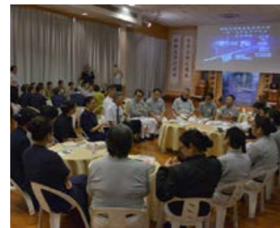
學員們交流對課程的感受及做心得分享

慈濟是一個互相成就的菩薩道場，大家在這裡彼此付出，彼此感恩，不斷成長，並把愛、善的種子傳播出去，以圓上人「人心淨化、社會祥和、天下無災難」的大願。