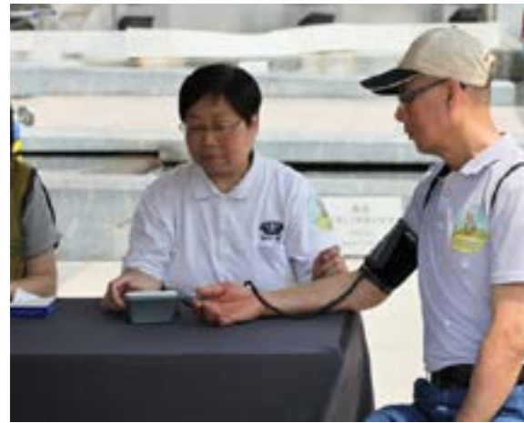
終點的攤位設有血壓測量站