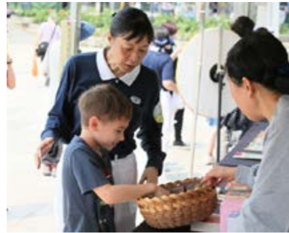
靜思語攤位提供《兒童靜思語》