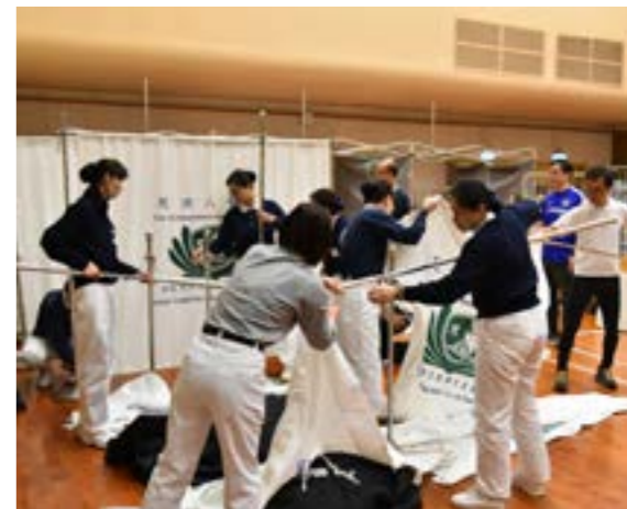
志工們忙著佈置義檢現場

香港人醫會用真誠的愛心，為偏遠的北區民眾，送上關懷和專業的醫療諮詢，做到了守護生命、守護健康、守護愛，希望不久的將來還能持續為他們服務。