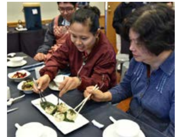
滿心期待品嚐桌上的佳餚

冬令圍爐現場，隨處可見公公婆婆和小孩，品嚐素食時一臉的幸福；而這充盈的溫馨人情味及素食幸福的滋味，是志工付出無所求的心營造出來的。