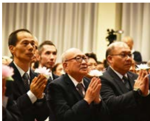
志工們手捧蓮花燈，祈願新的一年平安祥和