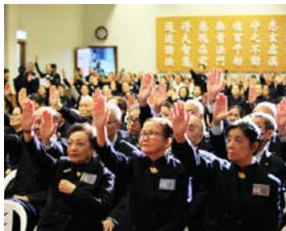
開場前，大家先練習手語暖場