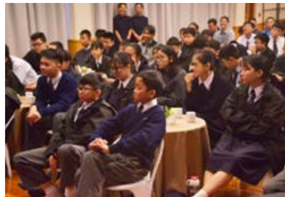
同學專心的聆聽志工的分享，對於內容感到有趣