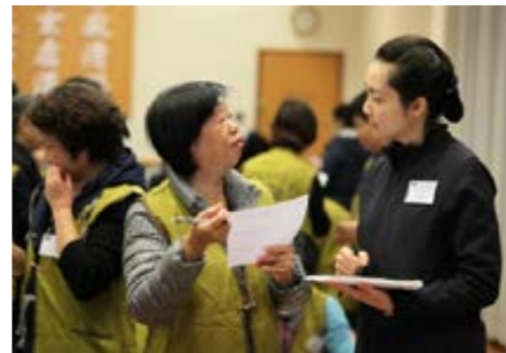
志工們運用「你我九宮格遊戲」互相交流

築物代表「以人為本」，以及「人圓、理圓、事圓」；大門前四柱屹立，象徵四大志業「慈善、醫療、教育、人文」，以及四無量心「慈、悲、喜、捨」，為別人拔苦，給人快樂，自己歡喜付出。