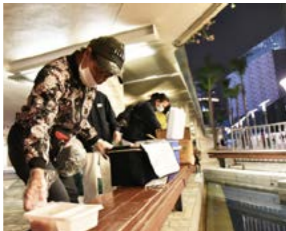
是街友也是志工的貴姐，在文化中心幫忙打飯盒