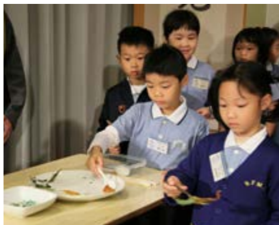
親子班的學員小心翼翼地使用湯匙撈起葉子

人人要瞭解每個人都有不同的特點，要建立自己的信心，勇於挑戰，克服困難，發揮自我潛能，時時提醒自己：不要小看自己，人有無限可能。