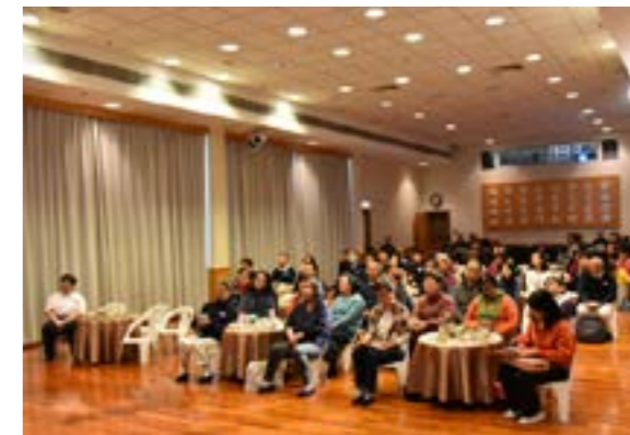
人文講座當天活動現場