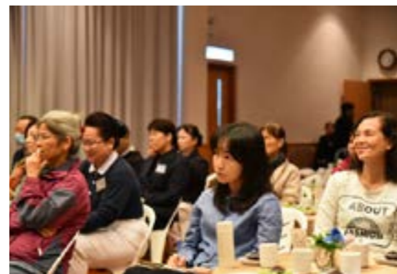
臺下的聽眾一邊認真的聆聽，一邊寫筆記