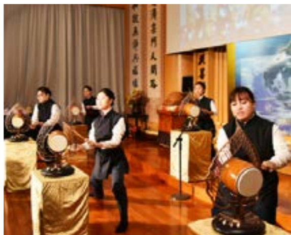
鼓隊五位成員演繹 < 揮灑生命的彩筆 >