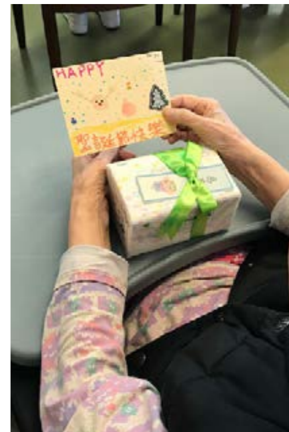
院友收到小志工們親手製作的卡片和聖誕禮物