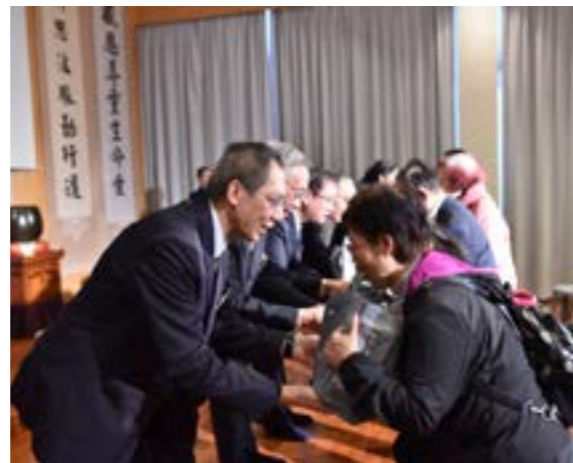
志工們將手上的物資以及誠心的祝福送給感恩、關懷戶