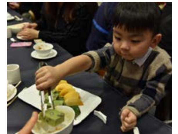
貼心的小朋友為同桌的大人裝取甜品