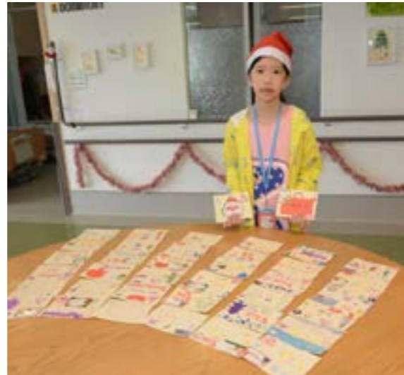
第一次當小志工的莫靜文，帶著與姊姊一起親手繪製的卡片，一共有數十張要送給院友

能量給他們。「感恩志工對院友的真誠關懷，讓院友每個月都期待著慈濟人的探訪，這份濃濃的愛，是志工長年累月無私的付出，並用心與院友互動累積得來的。」這是院方代表社工趙先生對慈濟人的感恩，更是一種鼓勵與肯定。