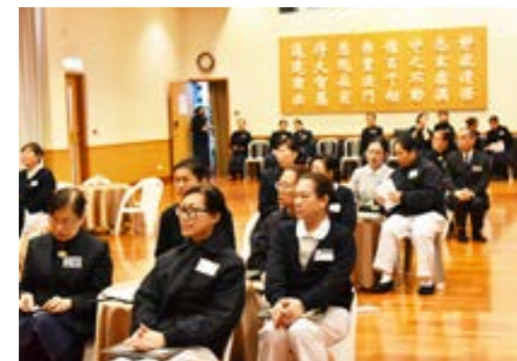
學員專心的聽課，有的一邊寫著筆記

當天的課程讓學員感動滿滿，也得到很多法水的滋潤。希望大家堅定而踏實地走這條菩提大直道，手牽手，一起走。